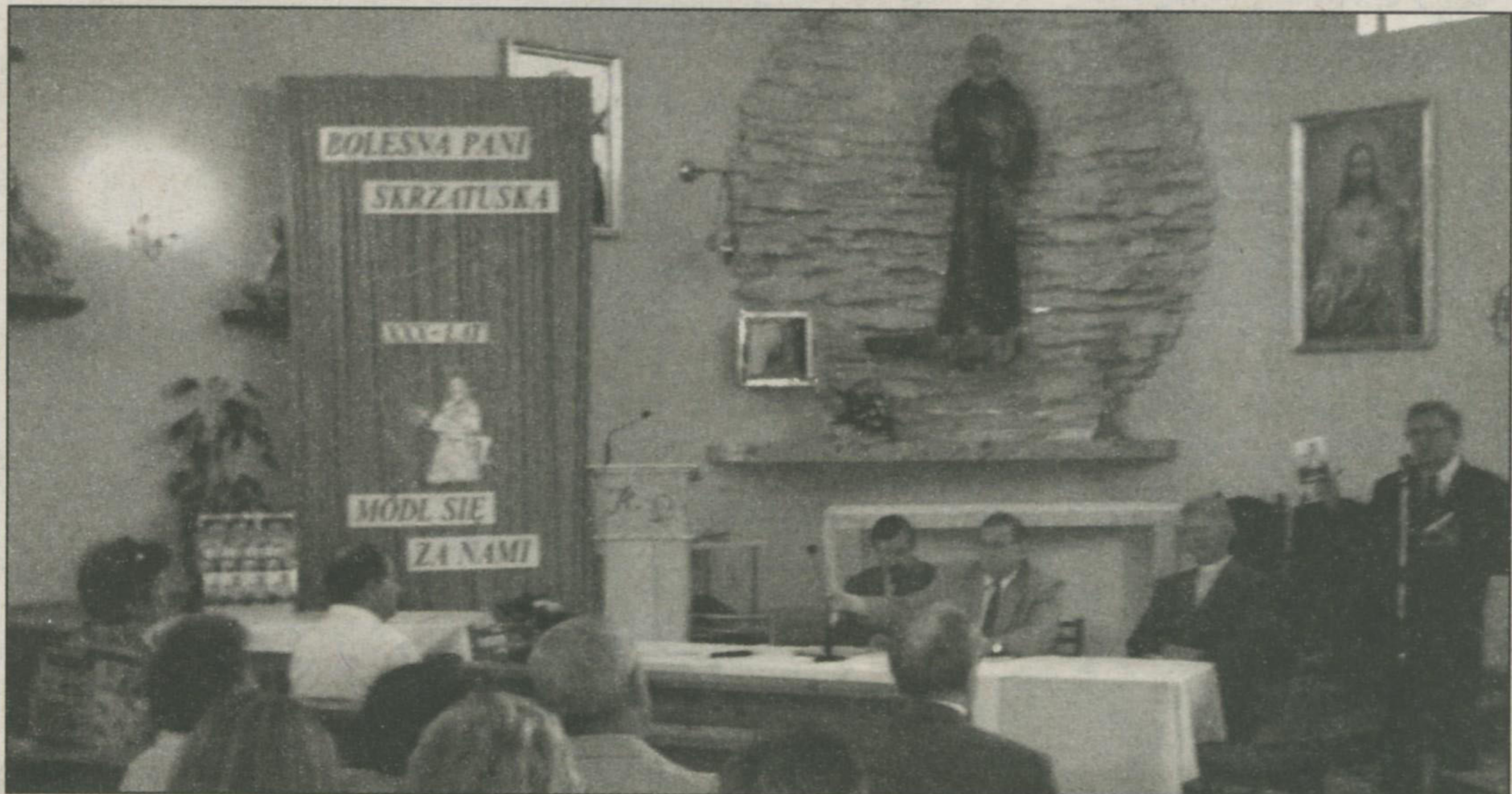
Spotkanie odbyło się w kaplicy św. M. Kolbego.

W książce autor zawarł wiele nieznanych kart skrzatuskiego sanktuarium.