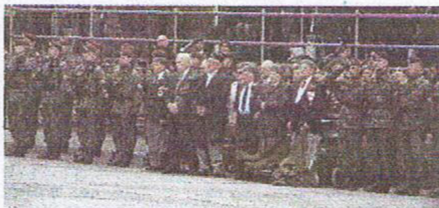
Haga, 31.05.2006. Polscy weterani – bohaterowie spod Arnhem, przybyli na uroczystości, w towarzystwie żołnierzy 6 Brygady Desantowo-Szturmowej.