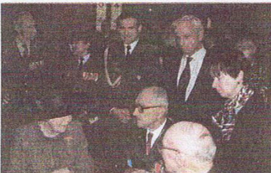
Haga, 31.05.2006. Królowa Beatrix w rozmowie z Weteranami.